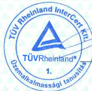
Tarnai Gyula Tanúsító

TÜV Rheinland InterCert Kft. Ipari szolgáltatások üzletág 1132 Budapest, Váci út 48/A-B. a GKM által bejegyzett szervezet